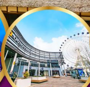
มิตซูเอากะไลท์พาร์ค เซนได